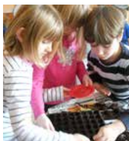
Spoznavanje, sejanje semen v različne modele