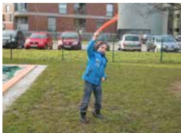
»Ujeli smo veter« in mu prisluhnili