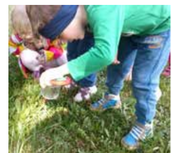
Opazovanje živali skozi lupo