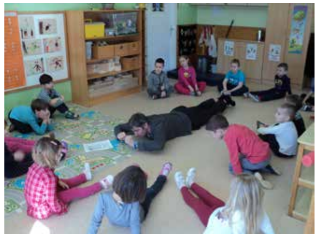
Izvajanje plavalnih vaj na suhem