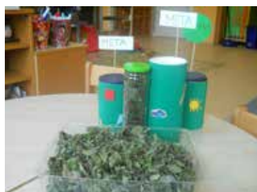
Mali zeliščarji ter označitve