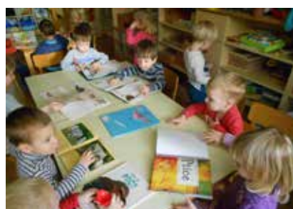
Informacije v literaturi