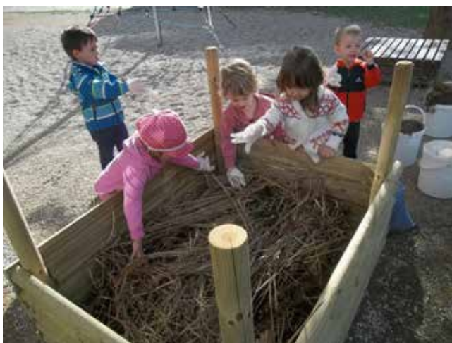
Priprava visoke grede

Ko je bila zunaj primerna temperatura, smo zelišča presadili na prosto, posadili smo tudi sadike zelišč in vrtnin, ki smo jih dobili od lokalnih vrtnarjev. Skrbi za naša zelišča in visoko gredo še zdaleč ni konec. Zelišča je potrebno negovati in zalivati, zato smo v naš kotiček postavili sod za zbiranje deževnice, s katero zalivamo rastline.