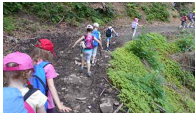
Izlet na Jakec