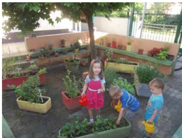
Zalivanje z deževnico

Izdelan je bil tudi hotel za žuželke, saj skrbimo tudi za male živali. V mesecu maju so naša zelišča in zelenjava že lepo zrastle, zato smo lahko poizkusili solato, v kuhinjo smo odnesli drobnjak, šetraj, luštrek, kuharji so jih dodali jedem za boljši okus. Ob poskušanju jedi, ki so jim bila dodana naša zelišča, so bili otroci zelo navdušeni in tudi okus jim je bil zelo všeč. Največje veselje je bilo, ko so v začetku junija dozorele prve jagode, saj so jih otroci sami potrgali in nato pojedli. Iz mete in melise smo pripravili sok, iz ognjiča pa ognjičevo mazilo.