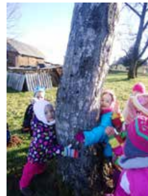
Debelina drevesna debla

Odkrivali so gozdne živali, jim brez strahu ponudili dlan nato pa vsakič izpustili v naravo. Opazovali so jih tudi skozi povečevalno lupo. Odkrivali so njihove sledi in zavetja ter s pesmico »Kdo živi v tej hišici« ugotavljali, kdo prebiva njih. Otroci so se tako na enostaven, neprisljen način navajali na spoštljiv odnos do živih bitij (rastlin in živali) ter varovanje le-teh.