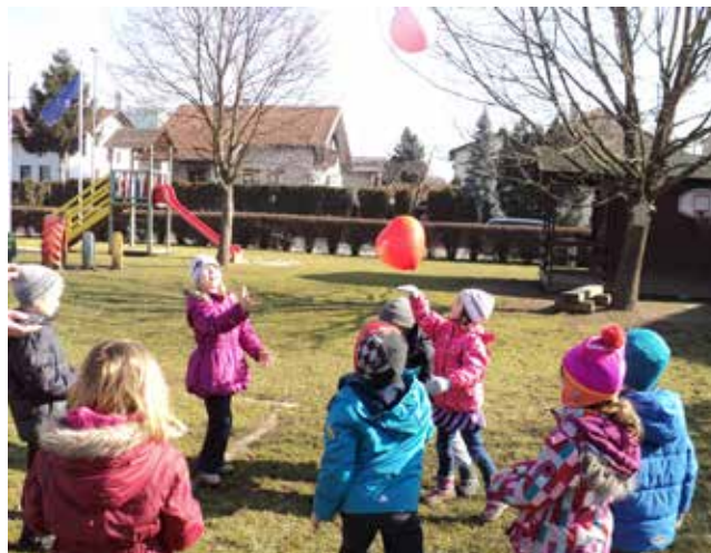
Bivanje na prostem

V našem vrtcu skrbimo za čisto, varno in zdravo bivalno okolje, v katerem se otroci dobro počutijo. Posebno skrb namenjamo zdravi prehrani, zračenju prostorov in gibanju ter igri otrok na svežem zraku. Nenehno spremljamo zdravstveno stanje otrok in izvajamo preventivne higienske ukrepe na področju preprečevanja in širjenja nalezljivih boleznih oz. okužb. Na zdravje otrok vpliva mnogo dejavnikov okolja, zato se zavedamo, da so pogosto gibanje in zdrave prehranjevalne navade, pridobljene v najzgodnejšem otroštvu pomembna popotnica za življenje. Zato moramo otroke že od njihovega zgodnjega otroštva navajati na zdrav način življenja, ki je pomemben tako za fiziološki, psihosocialni kot tudi za kognitivni razvoj posameznika.