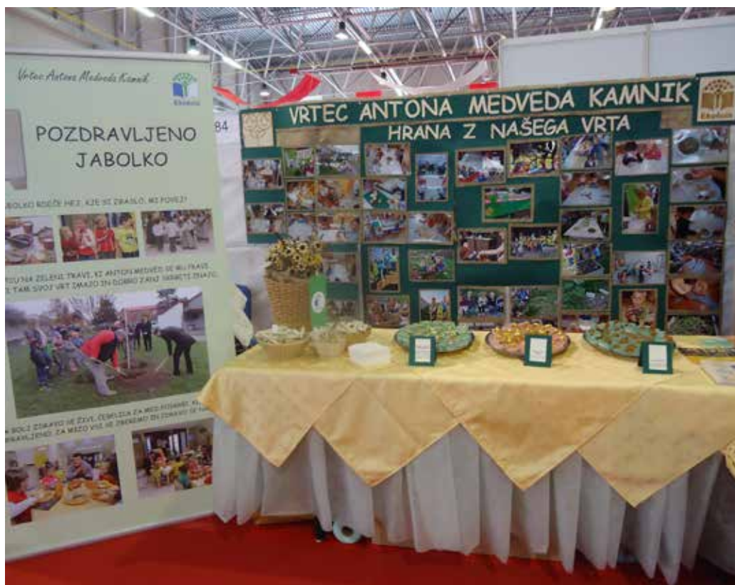
Stojnica na sejmu Altermed