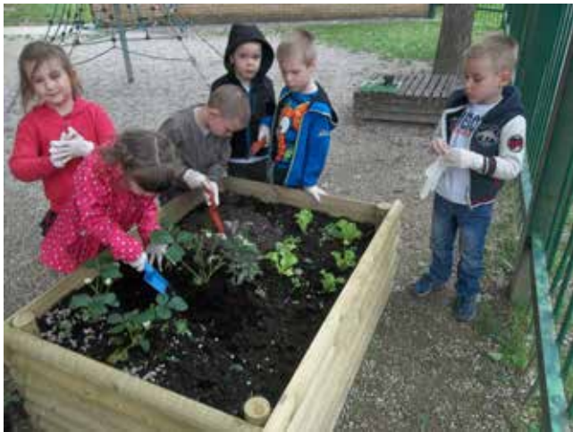
Urejanje visoke grede