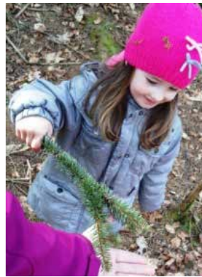
Spoznanje otrok: Iglavci pikajo