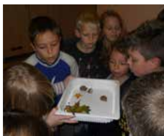
Primerjanje, opazovanje drobnih živali