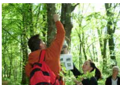
Postavitev gozdne učne poti