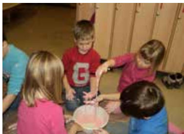
Poizkus z gustinom