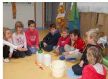
Poizkus z baloni