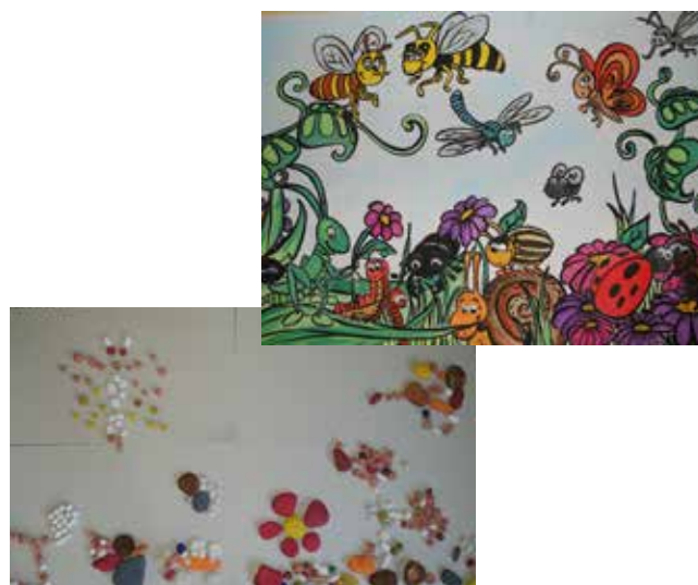
Izdelek nastal skozi igro iz prebarvanih kamnov po končani dejavnosti o snoveh, predmetih.. ter prostoročno naslikane drobne živali na dano temo (pridobitev s strani mamice otroka vključenega v dejavnost)

Bivanje v naravi, doživljanje in spoznavanje žive in nežive narave in s tem razvijanje naklonjenega, spoštljivega in odgovornega odnosa do narave so le nekateri cilji, naloge, ki si jih zadajamo že v predšolskem obdobju. Že v samem načrtu obogatitvene dejavnosti je bil zadan osebni cilj: otroka preko strategij mišljenja, raziskovanja, eksperimentiranja popeljati do tega, da začuti utrip narave, dejavnosti v povezavi s tem, okolje z vsemi čutili, da izraža svoja razpoloženja, občutke ter interese, kar smo tekom tedenskih dejavnosti tudi poskušali realizirati. Narava kot so že zapisali mnogi je dobra učilnica, ki nam s svojo raznolikostjo ponuja ogromno, le vključiti se je potrebno, se prepustiti določenemu sozvočju z naravo, sprejeti spodbude ter se osredotočiti tudi na cilje, procese. Pridobivanje znanja, spoznanj, izkušenj tako pozitivnih kot negativnih, iskati odgovore na vprašanja, se poglobljati, načrtovati... pa je le delček vsega kar se lahko otrokom ponudi in na tem tudi gradi.