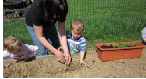
Presaditev sadik peteršilja na permakulturno gredo

Peteršilj je sedaj že dovolj velik za uporabo. Paprika pa še raste in še čakamo na njene prve plodove.