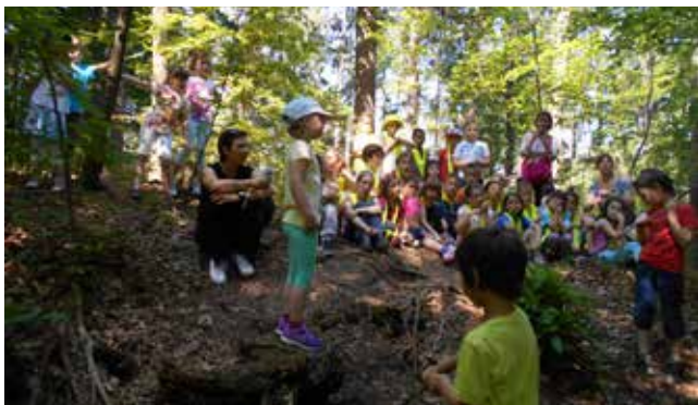
Prvošolci so si ogledali obe naši predstavi: Veliki nemarni škornji in Izgubljena veвериčka Katanja