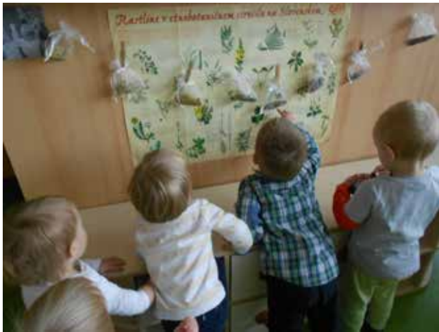
Opazovanje, tipanje in vonjanje zelišč v vrečkah.