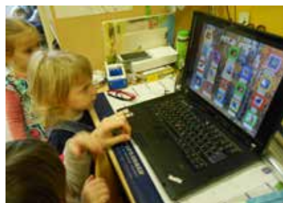
AV petje ptic