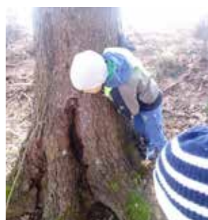
»Kdo živi v tej hišici«

Odkrivali so gozdne živali, jim brez strahu ponudili dlan nato pa vsakič izpustili v naravo. Opazovali so jih tudi skozi povečevalno lupo. Odkrivali so njihove sledi in zavetja ter s pesmico »Kdo živi v tej hišici« ugotavljali, kdo prebiva njih. Otroci so se tako na enostaven, neprisljen način navajali na spoštljiv odnos do živih bitij (rastlin in živali) ter varovanje le-teh.