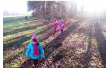
V gozdu je lepo