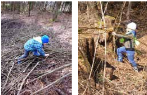
Naravni poligon: skok iz štora, hoja po robu na jasi ob gozdu, hoja po vejevju, premagovanje klančine

Vsak obisk gozda smo namenili tudi prosti igri in raziskovanju. Tu se je pokazala povezanost skupine. Pri igri v gozdu so bili otroci strpni drug do drugega, med seboj so sodelovali ter si pomagali. Vsak je lahko izrazil svoje mnenje, tako so se skupaj dogovarjali za potek igre. Obenem pa so prilagajali jakost govorjenja naravnemu okolju, saj smo se dogovorili, da ne bomo preglasni, saj bi s tem prepodili živali v gozdu. Njihova domišljija pri igri res ne pozna meja. Drevesne veje so v hipu postale orodje gozdarjev, štor lonec za gozdno juhico in palica za mešanje, skupina fantov je nabirala vejevje in si pripravljala drva za zimo, deklice so našle podrto deblo in se na njem gugale. Drevo pa je postalo tudi gusarska ladja sredi gozdnega »morja«.