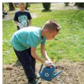
Skrb za zasajeno