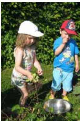
Slika 4: Nabiranje solate

Prvi pridelek, katerega smo zaužili, je bila redkev. Otroci so jo sami izpulili in umili. Vanjo so ugriznili vsi vendar večini ni teknila. Naslednja je bila na vrsti solata. Ko so sadike že dovolj zrasle, so jih otroci izpulili in otrsli zemljo s korenin, midve sva odrezali korenine, katere so nato odnesli v kompostnik. Solato so nato ponosno odnesli v kuhinjo in jo pri kosilu pojedli. Pojedli smo jo več kot običajno, poskusili pa so jo tudi tisti, ki je sicer ne jedo. Na najpomembnejši pridelek pa smo morali počakati skoraj do konca šolskega leta. Otroke so seveda najbolj zanimala jagode in komaj so čakali, da dozori. Ko se le-te obarvajo rdeče, jih takoj pojedjo. Na grah in kolerabo pa bomo morali še malo počakati.