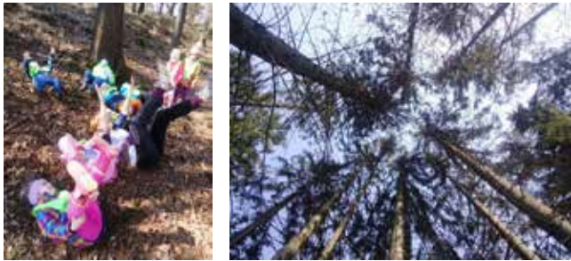
Ležanje na gozdnih tleh in dotikanje drevesnih krošenj

Nato so pripovedovali, kaj vse so slišali: »Ptičke, listke, veter, letalo, ko si stopila.«