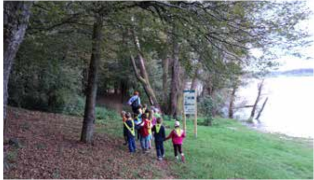
Sprehod ob jezeru v Kraščih