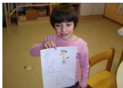
Ptički iz geometrijskih oblik