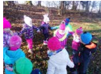
Bela, bela lilija v gozdu

Tik pred odhodom v vrtec pa smo si z otroki vedno vzeli čas za kakšno socialno ali rajalno igrice (npr. Bela, bela lilija , Diradičindara , Medved , koliko je ura ali pa Lisica , kaj rada ješ... ). V odprtem naravnem okolju so se še posebej radi povezovali med seboj, si podajali roke, zaplesali in prepevali pesmi. Prav žalostni so bili, ko smo zapuščali gozdne koticke. Ampak si vsakič dejali, da se kmalu spet vrnemo.