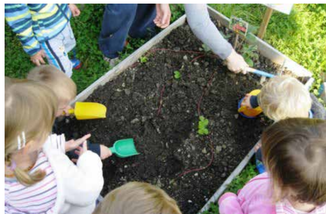
Priprava gredice na zimovanje

Gredico smo prevzeli od lanskoletne skupine Metuljčkov. Na njej so rasle jagode in veliko plevela, ki smo ga odstranili in gredico pripravili na počitek. Vsak dan, dokler ni zapadel sneg, so otroci hodili in pulili vse, kar je pogledalo iz zemlje.