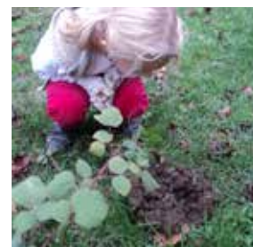
Drobne živali v naravi