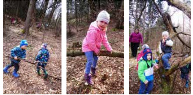
Gozdne »igrarije« so plod otroške domišljije

Tik pred odhodom v vrtec pa smo si z otroki vedno vzeli čas za kakšno socialno ali rajalno igrice (npr. Bela, bela lilija , Diradičindara , Medved , koliko je ura ali pa Lisica , kaj rada ješ... ). V odprtem naravnem okolju so se še posebej radi povezovali med seboj, si podajali roke, zaplesali in prepevali pesmi. Prav žalostni so bili, ko smo zapuščali gozdne koticke. Ampak si vsakič dejali, da se kmalu spet vrnemo.