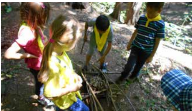
Instalacija iz palic - Ogenj