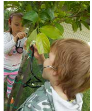
S stetoskopom bova prisluhnila drevesu

Kot kaže interes otrok, pa še ne zaključujemo našega raziskovanja, saj imajo otroci še nekaj načrtov za nova opazovanja. Radi bi skupaj v vrtcu prespali in v temi opazovali metulje in druge nočne žuželke, kako letajo okrog našega drevesa. Pozimi pa bi pticam pripravili lojne pogačice in jih obesili na drevo, da bi lažje prenesle mrzle zimske dni. Zagotovo se bo utrnula še kakšna ideja, če bomo le znali izkoristiti zanimanje otrok.