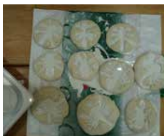
Vlivanje gipsa v odtise modelov živali