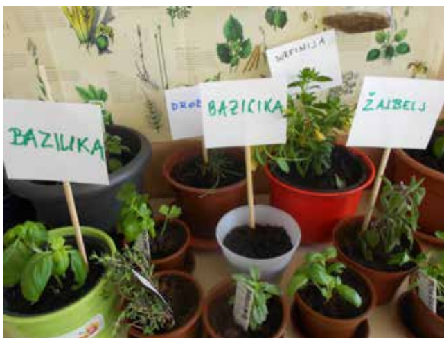
Ureditev zeliščnega vrta v lončkih.