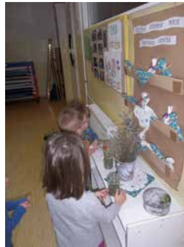
Zeliščna lekarna čarovnice Lenčke