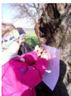
Odtisi drevesnega lubja