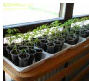
Sadike pripravljene na zasaditev