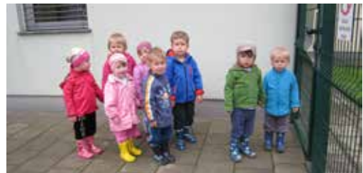
Odpravljamo se nabirat peteršilj

Peteršilj je sedaj že dovolj velik za uporabo. Paprika pa še raste in še čakamo na njene prve plodove.