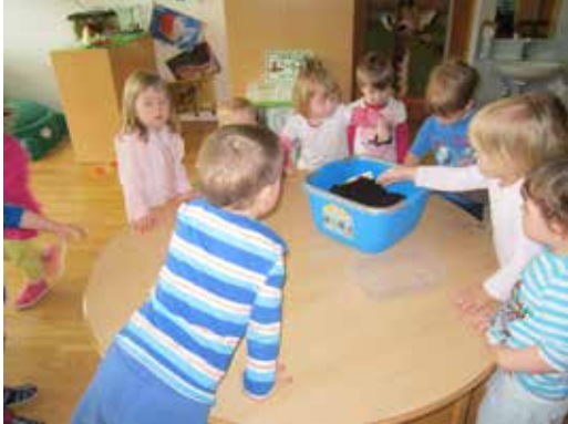
Igra z zemljo

vrtnarjenju, kdaj začeti sejati in presejati ter se veliko igrali z zemljo. Iz knjig smo izvedeli, da je Valentin (14. 2.) zelo pomemben svetnik naših prednikov in narave, saj prinaša ključ do korenin. To pomeni, da se začne narava spet prebujati in je pravi čas za prvo sejanje v lončke, ki ostanejo še nekaj časa na toplem.