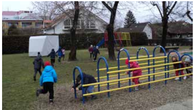
Gibalni odmor na našem igrišču