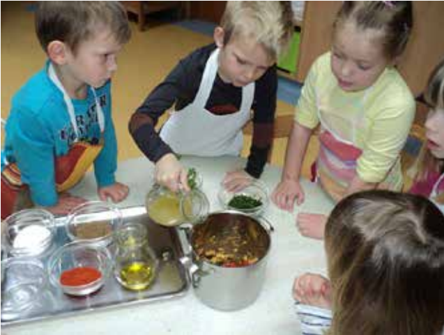
Priprava čičerikinega namaza s pečenim korenčkom