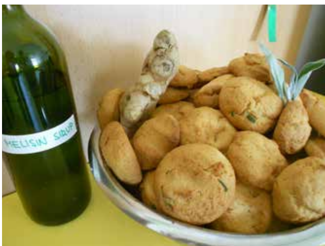
Melisin sirup ter medenjaki z ingverjem, žajbljem in pehtranom.

Otroci so z vsemi svojimi čuti spoznavali različna sveža in posušena zelišča; jih opazovali, tipali, vonjali in okušali v različnih oblikah. Odkrivali in spoznavali so njihove lastnosti, pripravo in uporabo (zeliščni čaj z medom in limono, čemažev namaz, piškoti s pehtranom, ingverjem in žajbljem ali melisin sirup z žajbljem in ingverjem ipd.) ter si pri tem pridobivali navade zdravega in raznolikega prehranjevanja in razvijali družabnost, povezano s prehranjevanjem (priprava in kuhanje različnih vrst čajev ter organiziranje čajanke z otroki iz drugih skupin). S pomočjo odraslih ter možnostjo opazovanja odraslih pri delu in posnemanja so se seznanjali s sajenjem in skrbjo za zelišča (ureditev zeliščnega vrta v lončkih s pomočjo starih staršev, presajanje, zalivanje), predvsem pa so razvijali in oblikovali sistem vrednot, ki so jih pričeli prenašati tudi na svoje starše.