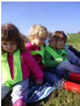
Igra tišine na jasi pred gozdom

Na tleh so opazovali prodiranje sončnih žarkov in svojo senco. S tipanjem so prepoznavali teksturo drevesne skorje, mehko zelenega mahovja, z objemi dreves pa preverjali debelino drevesnega debla. Prepoznavali so značilnosti listavcev in iglavcev ter preizkušali plovnost najdenega naravnega materiala.