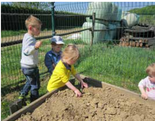
Presaditev sadik paprike na prosto

Pri zbiranju semen, smo za pomoč poprosili starše, ki so se z zanimanjem odzvali. Zbrali smo veliko semen, ki smo jih potem pripravili tudi za izmenjavo. To pomeni, da so si starši lahko vzeli semena, ki jih potrebujejo. Z izmenjavo smo tudi starše spodbudili k sejanju. V vrtcu smo pripravili prostor za sejanje peteršilja in paprike. Otroci so sami posejali semena in jih ob pomoči tudi redno zalivali. Ko je bil čas in sadike dovolj velike, smo papriko in peteršilj posadili na gredo. Vsak dan smo skrbno zalivali in opazovali rast sadik.