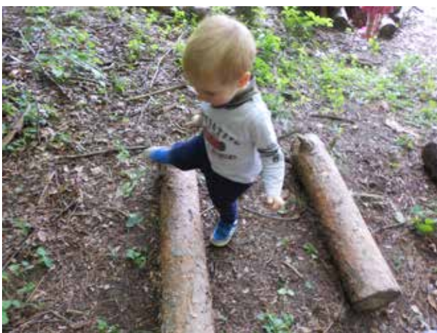
Premagovanje naravnih ovir – prestopanje hlodov.