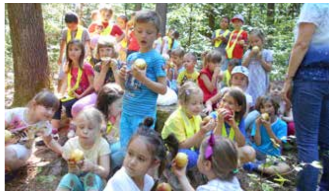
Malica pri mizici pogrnj se