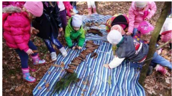
Razvrščanje naravnega materiala